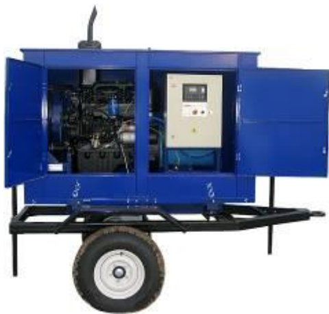
дизель-генератор в погодозащитном капоте на шасси