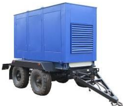
дизель-генератор в погодозащитном капоте на шасси