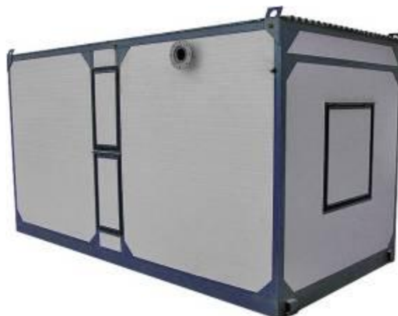
дизельная электростанция в блок контейнере «Север»

Дизель-генераторные установки в зависимости от условий эксплуатации могут быть выполнены в следующих исполнениях: