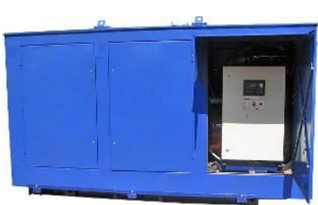
дизель-генератор в погодозащитном капоте