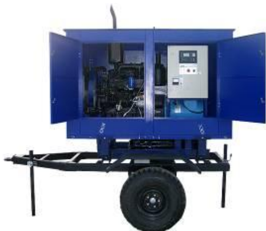
дизель-генератор в погодозащитном капоте на шасси