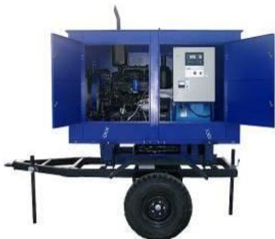
дизель-генератор в погодозащитном капоте на шасси