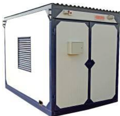
дизельная электростанция в блок контейнере «Север»

Дизель-генераторные установки в зависимости от условий эксплуатации могут быть выполнены в следующих исполнениях: