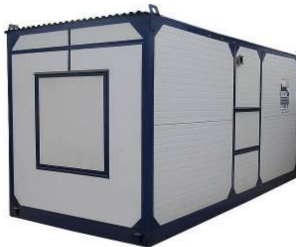
дизельная электростанция в блок контейнере «Север»

Дизель-генераторные установки в зависимости от условий эксплуатации могут быть выполнены в следующих исполнениях: