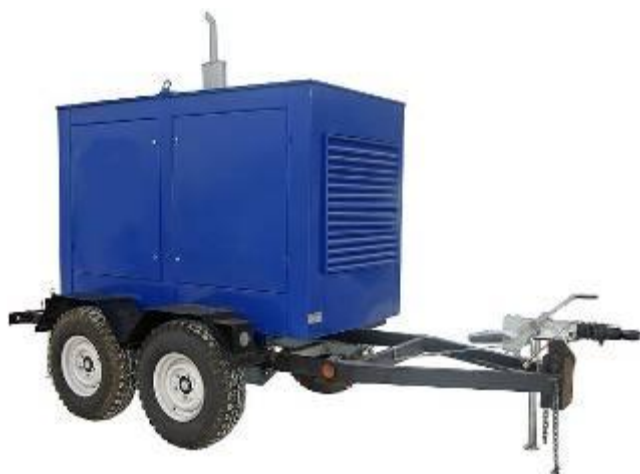
дизель-генератор в погодозащитном капоте на шасси